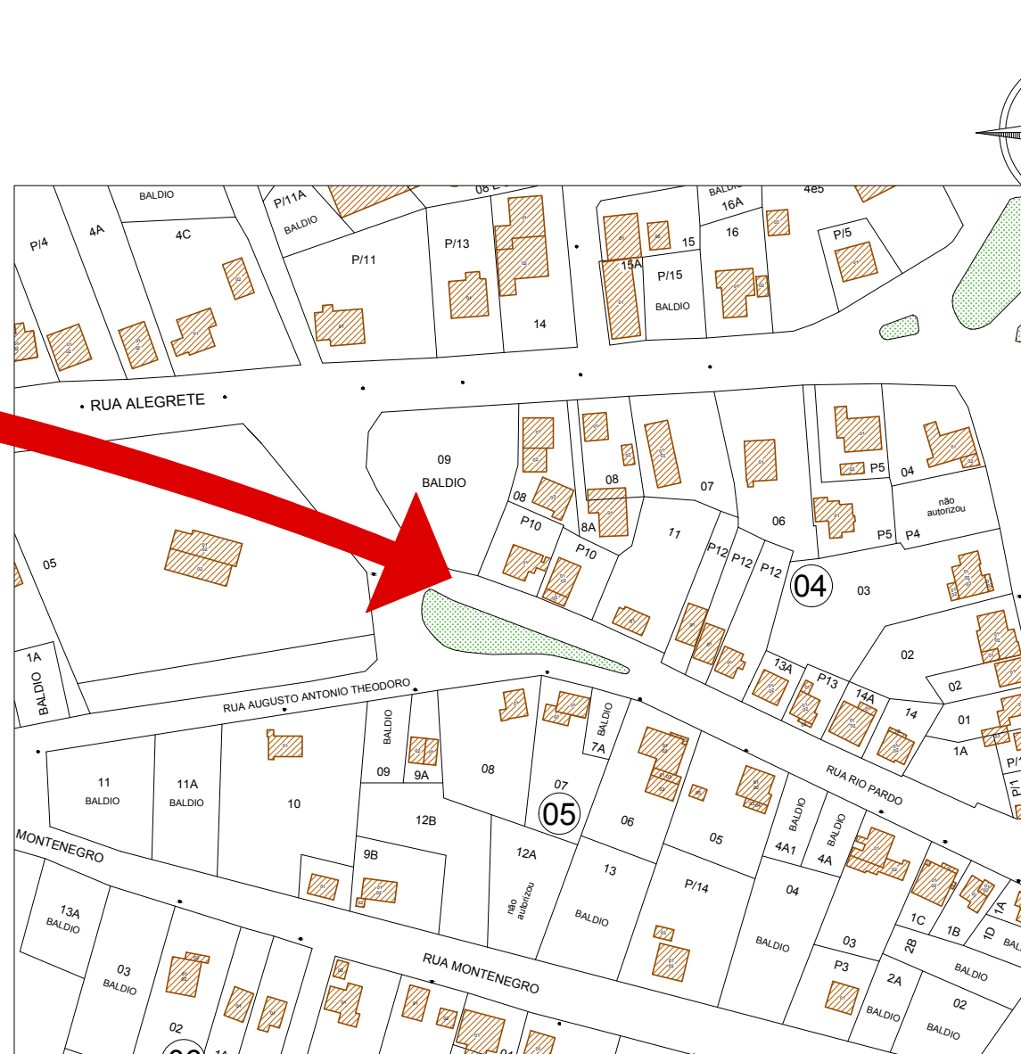
1 LOCALIZAÇÃO 1:2000